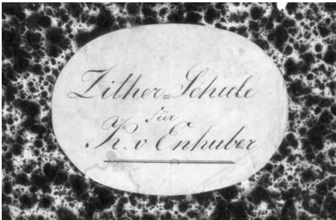
Abb. 96: Plakette auf dem Einband des faksimilierten Exemplars der Neuen theoretisch praktischen Zither-Schule von Nikolaus Weigel